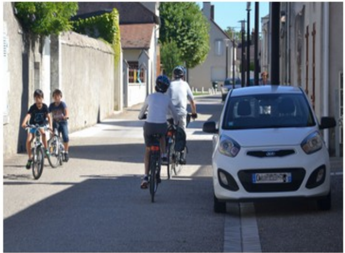
"Les territoires peu denses : quels leviers pour dynamiser l'écomobilité ?" - 15 Octobre 2019 à Barentin (76)