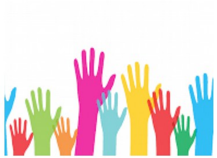
La cellule régionale France Mobilité Normandie se lance