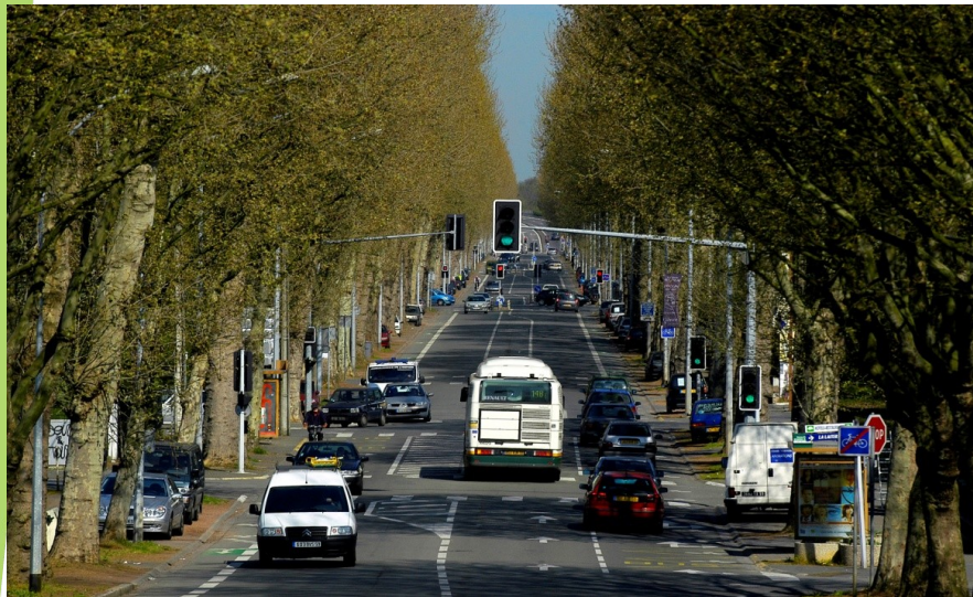
Fragmentation entre espaces d'usages différents

Equation à résoudre dans un contexte d'une complexité croissante des espaces publics :