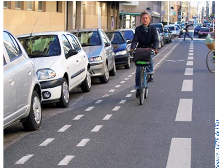
Espace tampon en cas de stationnement longitudinal

Dans le cas d'une bande cyclable longeant des places de stationnement, il est souhaitable de réserver une surlargeur de 0,50 m ou un espace tampon pour permettre l'ouverture inopinée de portières et les manœuvres des automobilistes sans danger pour les cyclistes.