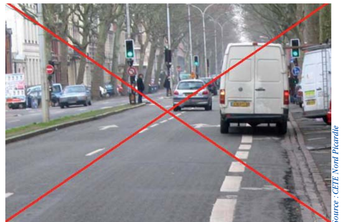
Ce stationnement sur la bande cyclable empêche la progression du cycliste en sécurité

L'implantation d'une bande cyclable implique d'avoir une politique de répression du stationnement sauvage.