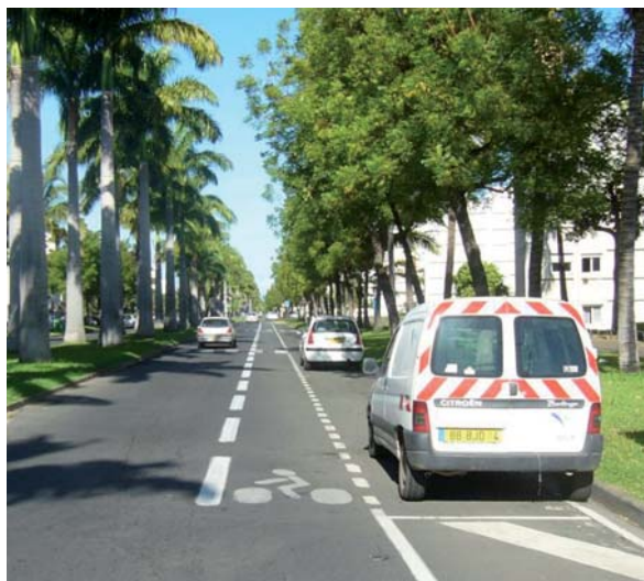
Exemple de bande cyclable