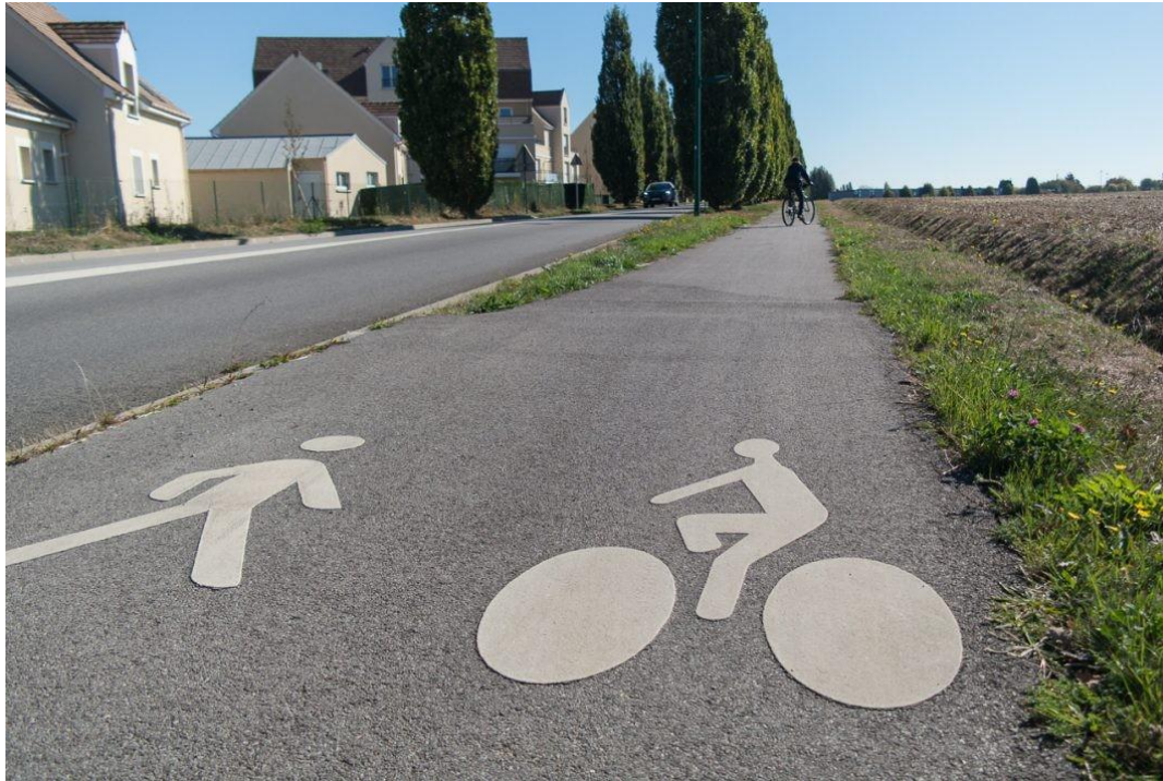
Voie douce à Plaisir (78)

« Le vélo et la marche peuvent contribuer efficacement à remplacer la voiture »