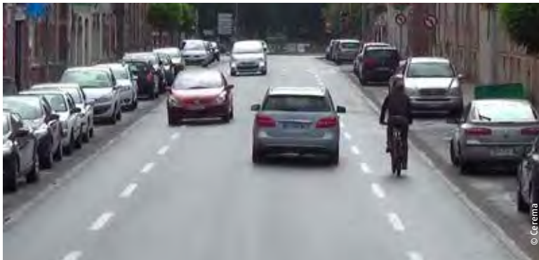
Utilisée généralement en milieu rural ou périurbain, la CVCB peut également être mise en œuvre en ville, à l'image de Saint-Omer et Dieppe.

mais de l'ordre de quelques km/h seulement. L'analyse qualitative effectuée dans la CVCB du Pays Voironnais indique qu'en présence de cyclistes les vitesses semblent avoir plus fortement baissé, le nombre de véhicules