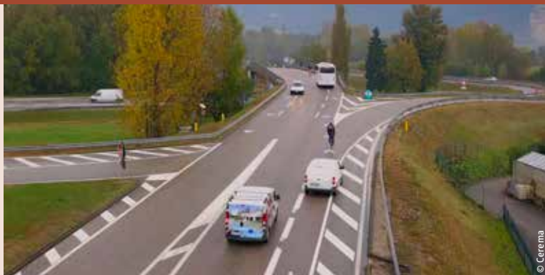
Pays voironnais : CVCB sur le pont du Pavé franchissant la RD 1085.

Afin de renforcer la sécurisation d'un itinéraire cyclable au sein de la zone d'activité de Centr'Alp, une chaussée à voie centrale banalisée a été mise en place en septembre 2016 sur le pont du Pavé. Cette réalisation s'est accompagnée d'un suivi et d'une évaluation par le conseil départemental et par le Cerema, intégrant l'observation des comportements, le retour des usagers, et la mesure des débits et des vitesses. Globalement, l'instauration de cette CVCB a permis d'améliorer le sentiment de sécurité des cyclistes, notamment des conditions de dépassement. Toutefois, pour pérenniser cet aménagement, quelques actions, dont certaines correctives, ont dû être menées. Suite aux retours des usagers sur notamment leur sentiment initial d'incompréhension de cette CVCB, un effort de communication a été entrepris en décembre 2016, avec le remplacement des panneaux de présignalisation par des panneaux intégrant un schéma de fonctionnement, et le marquage de figurines vélo en association des doubles chevrons.