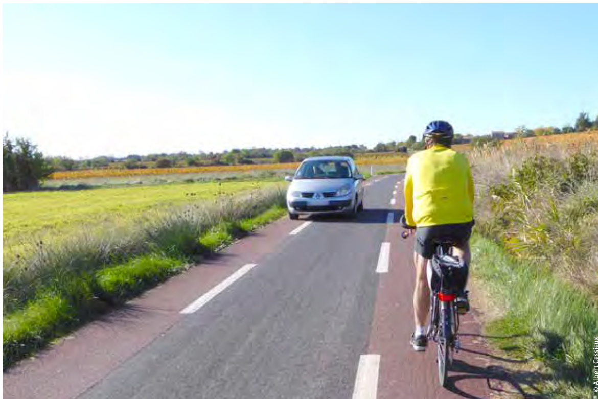
La mise en place d'une CVCB améliore le sentiment de sécurité des cyclistes empruntant ce trajet.