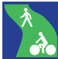
Illustration 2: C115

C'est le décret du 30 juillet 2008 qui a officialisé le statut de la voie verte. Il s'agit d'une route exclusivement réservée à la circulation des véhicules non motorisés, des piétons et également, avec l'ajout d'un panneau dédié, des cavaliers.